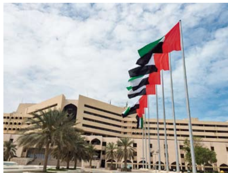
Optima presta sus servicios en el Hilton Grand Gate de Abu Dhabi. E. C.

Pero las perspectivas incluyen una mayor expansión ya que ha presupuestado al Grupo Sanjosé el