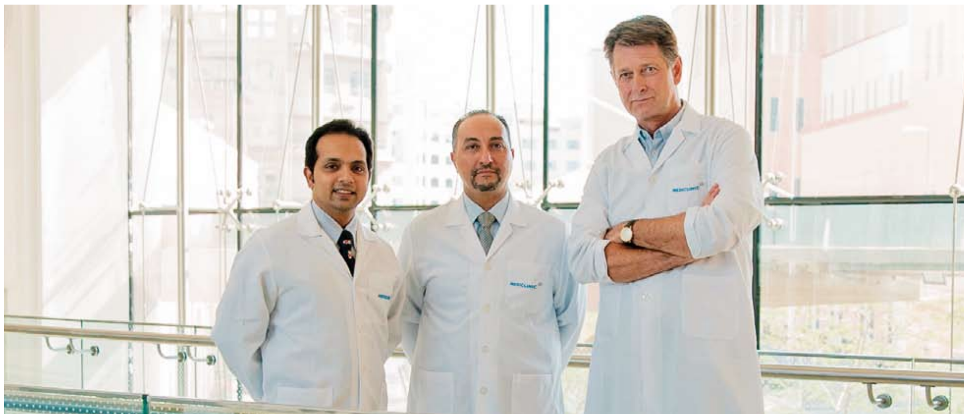
Especialistas médicos que integran el equipo de Ortopedia de Mediclinic Healthcare City.