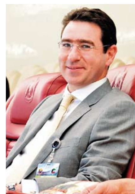
Los aficionados colombianos no dejaron de animar a su selección. El embajador de Colombia, Faihan Al-Fayez, también acudió al estadio para seguir el partido. MANAF K. ABBAS