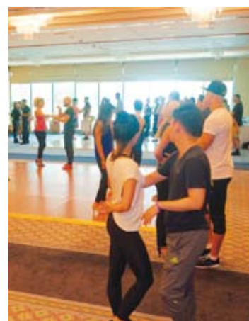
Taller de baile y JBR tomado por latinos. DUBAI LATIN FEST