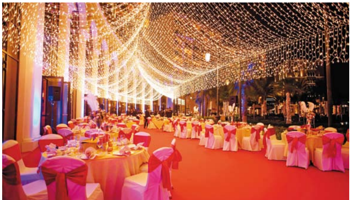
El Ritz-Carlton de Abu Dhabi lucirá sus mejores galas para celebrar la Feria de Abril.

La fiesta tendrá lugar en la terraza, donde se ubicará la pista de