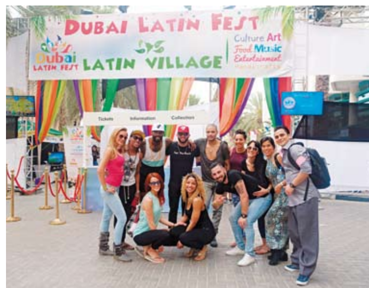
Latin Village atrajo las miradas de miles de personas. DUBAI LATIN FEST