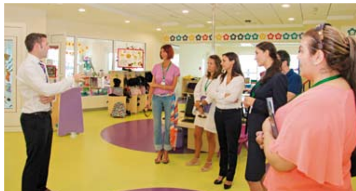
Un momento de la visita a Safa Community School.

Safa Community School, que abrió sus puertas en septiembre