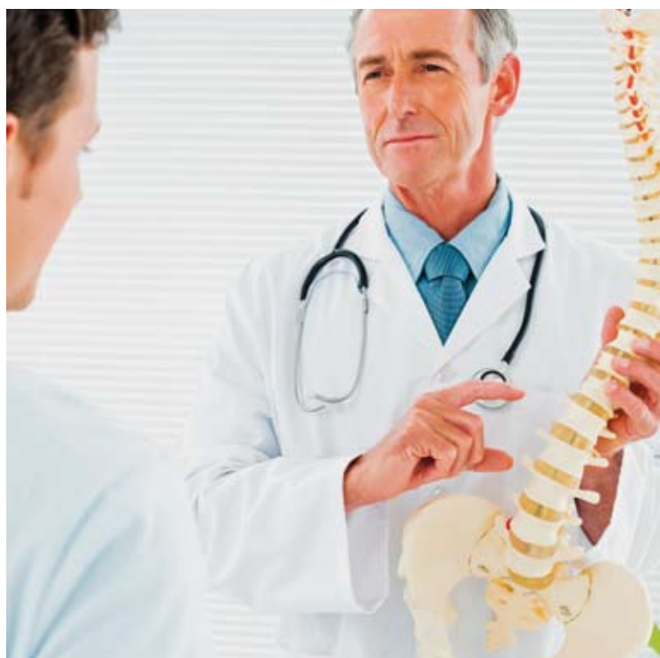
Una de cada diez personas sufre en el mundo dolor de espalda. E. C.

1. Sólo muy pocas veces el dolor de espalda está relacionado con el desplazamiento de discos o con nervios agarrotados. Incluso entonces, por lo general la espalda mejora por sí sola sin necesidad