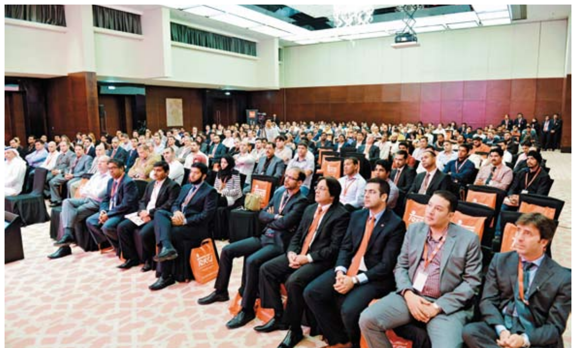
Aspecto del hotel The Address de Dubai Marina durante la presentación.

Teka, el patrocinador más laureado de la historia del club, se convierte de esta forma en el primero que regresa al Real Madrid