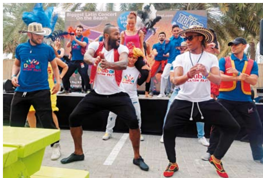
Richie Ray y Bobby Cruz, durante su actuación en Latin Concert -izquierda-. A la derecha, bailarines atrapados por los ritmos en el corazón de Dubai.