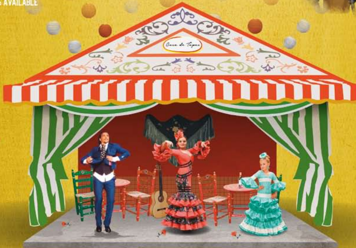
SONIQUETE AL ANDALUS