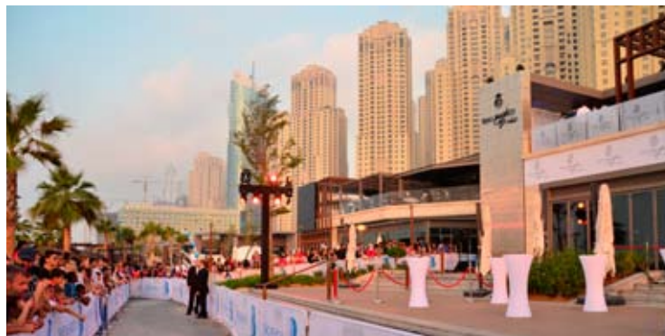
Miles de fans se concentraron ante el Real Madrid Café Dubai.