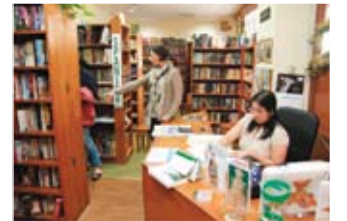
El Club está en House of Prose.