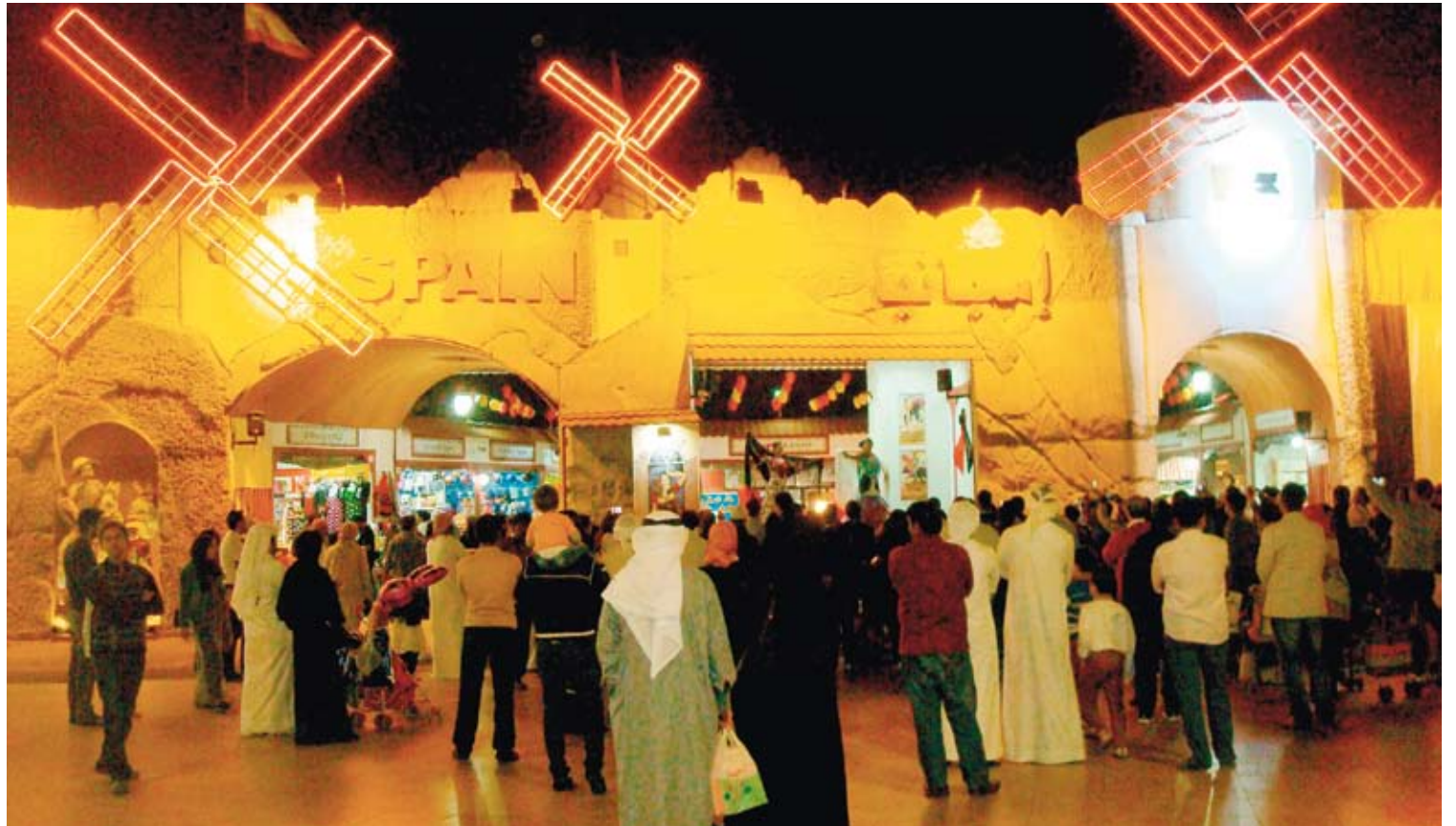
La inauguración del Pabellón de España generó gran expectación entre las personas que se encontraban en Global Village.

El Pabellón de España dedica esta temporada a la celebración del 400 aniversario de la publicación íntegra de Don Quijote de la Mancha, obra cumbre de Miguel de Cervantes Saavedra, efeméride en torno a la cual organizará actividades hasta el 11 de abril.