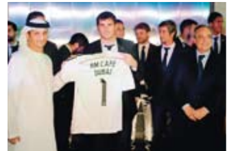
Casillas muestra una camiseta.