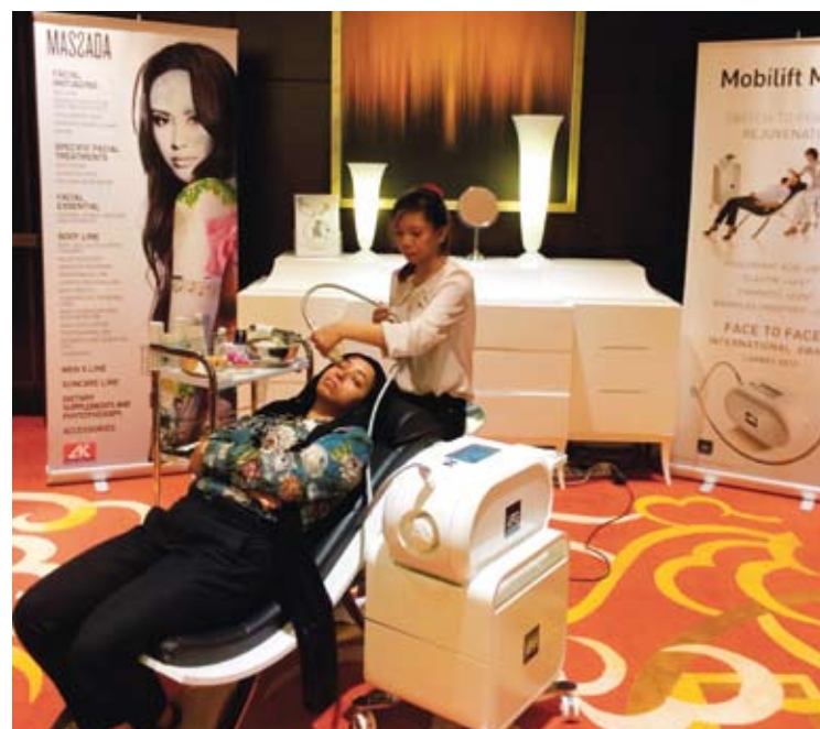
Stand de Massada Natural Therapy en ICAAM Dubai.

La alianza estratégica que Gulf Business Consulting estableció con la empresa local AK International, principal sponsor de ICAAM, es la sólida base para posicionar a la empresa navarra Massada en la élite de la cosmética natural de Emiratos Árabes Unidos.