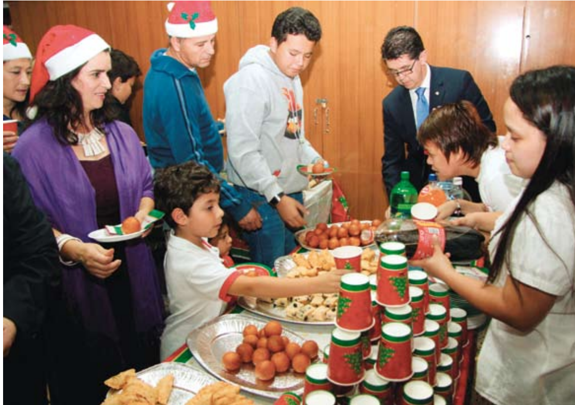
Durante el encuentro se degustaron platos colombianos típicos de las fechas.