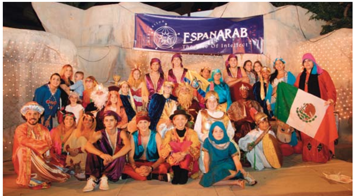
Foto de familia de los Reyes Magos de Dubai junto a sus pajes en Wafi Mall.

El resultado fue una animadísima velada que ha recabado el aplauso generalizado de todos por la nueva ubicación en Wafi Mall.