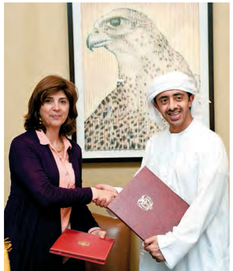
El ministro de Relaciones Exteriores de Emiratos Árabes Unidos junto a la canciller de Colombia durante la firma de los convenios.

Los premios TPO Network Awards Empresa también ha reconocido el trabajo de Lituania como país desarrollado; Mauricio como pequeño estado insular en desarrollo; y Zambia como país que aspira a entrar en vías de desarrollo