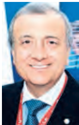
NELSON YEMIL CHABÉN Embajador

LOS Emiratos Árabes Unidos han alcanzado su actual prosperidad y su segura proyección de desarrollo futuro en dos conceptos sólidamente arraigados: Paz y Seguridad.