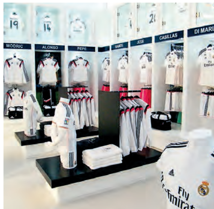
La tienda ofrece más de 40 productos oficiales del Real Madrid. E. C.

Real Madrid Café está abierto entre semana desde las 10 de la mañana a las 12 de la noche, hora que se prolonga hasta la 1 de la madrugada durante los fines de semana.