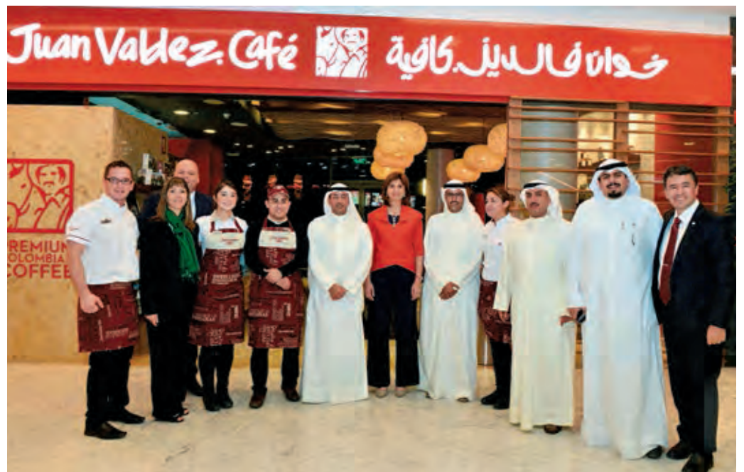
A la izquierda, representantes de la Embajada de Colombia en Emiratos Árabes Unidos en el expositor de AmoCafe durante el Festival Internacional de Café y Té celebrado en Dubai. Al lado, la ministra de Relaciones Exteriores y el encargado de la Embajada de Colombia, entre otros, ante la tienda de Juan Valdez en Kuwait.