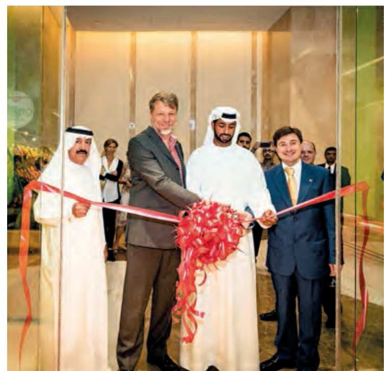
Inauguración de la tienda de Organic Foods en Abu Dhabi.

Organics Foods and Cafe fue fundada en 2005 y cuenta con otras tres tiendas en Dubai, en Sheikh Zayed Road, The Greens y en el Village Mall de Jumeira 1, así como en Bahrein, Masdar y ahora también en Abu Dhabi, capital de Emiratos Árabes Unidos.