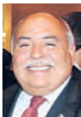
FRANCISCO ALONSO Embajador

Es un honor para la Embajada de México en los Emiratos Árabes Unidos dirigirse a EL CORREO DEL GOLFO para expresar nuestro agradecimiento por la generosa recepción que nos ha ofrecido el pueblo y el gobierno de los Emiratos desde mi llegada como cónsul en noviembre del 2008 y posteriormente en el proceso de apertura de la Embajada en Abu Dhabi el 7 de enero de 2012.