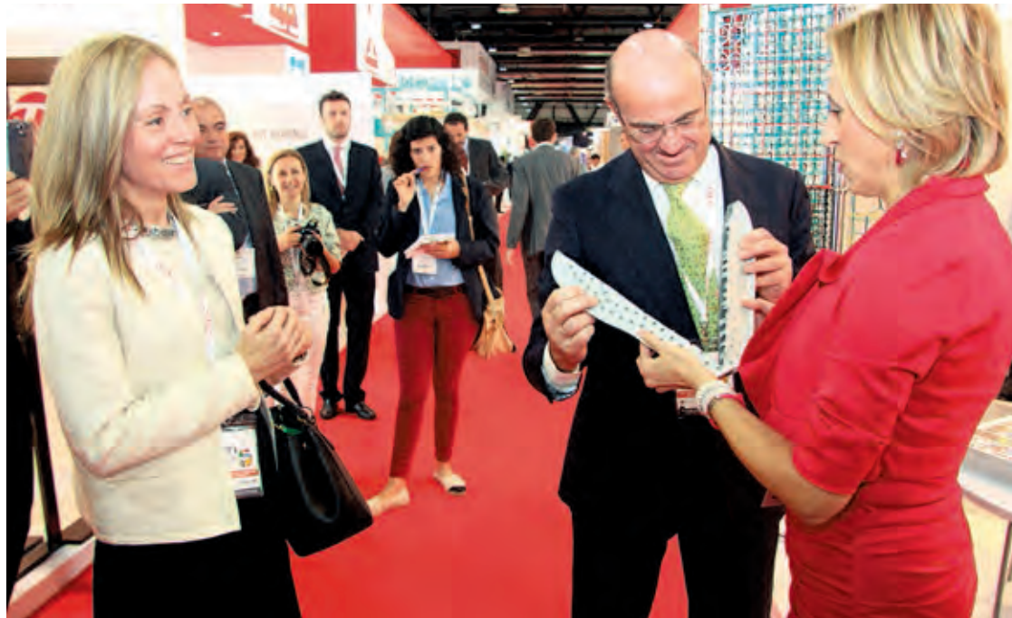
El ministro Luis de Guindos visita uno de los stands españoles en 'The Big 5'.

En este sentido subrayó que “las perspectivas de negocio son buenas” y que “The Big 5” es un polo de “atracción para potenciales compradores de África y Asia”. “The Big 5” acoge a 2.700 compañías expositoras de 60 países, de las cuales más del 70% son