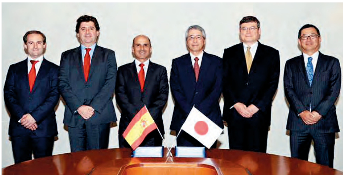
Foto de familia tras la firma del acuerdo entre Cepsa y Cosmo.