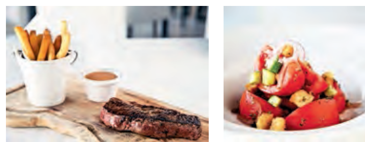
El menú del restaurante presenta exquisitas propuestas. E. C.