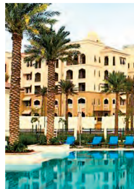
Viviendas en Emiratos Árabes. E. C.

"También ayudamos con temas relacionados con reubicación, decoración, conexión de agua y luz y asesoramiento en temas que van desde la elección