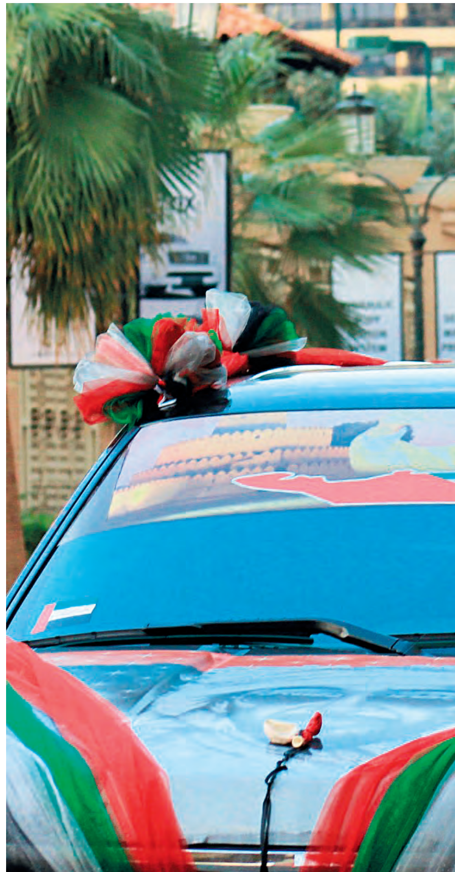
Un vehículo en Dubai Marina durante el Día Nacional. CELIA UNQUILES.

rrer. Lo evidencia, por ejemplo, la actividad que desarrolla Italia, que tiene actualmente operando en Emiratos a 300 compañías, una cifra superior a la totalidad de empresas hispanas.