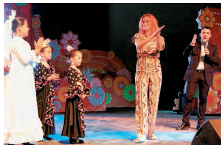
Ana Pérez Dance School cautivó en el escenario de Global Village. E. C.