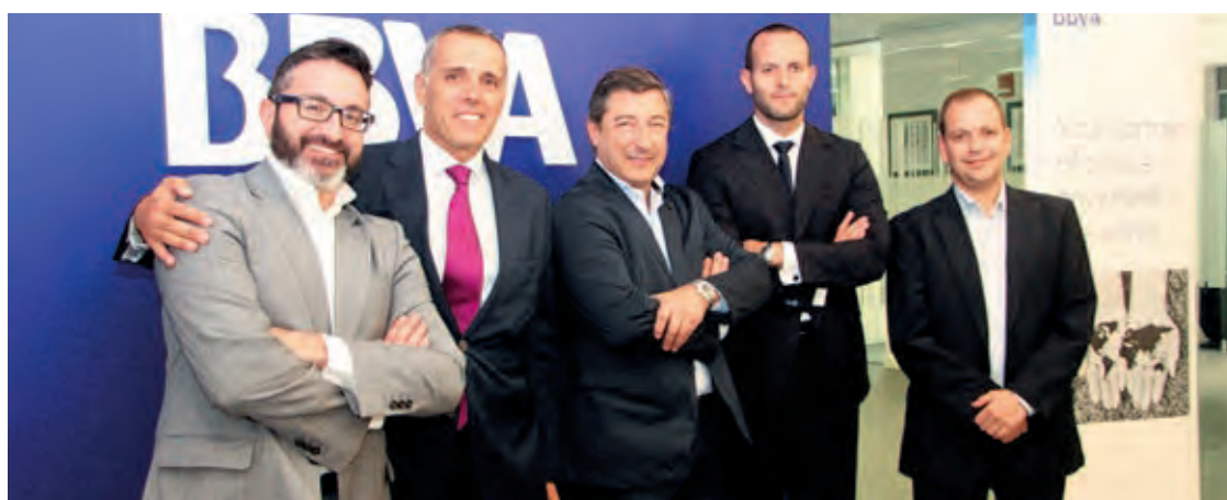
Joan Roca, que aterrizó en Dubai de la mano del BBVA, protagonizó en el restaurante Seville's un masivo acto en el que no faltaron ni célebres cocineros españoles ni rostros conocidos de la ciudad.