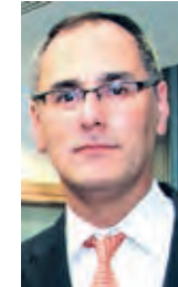
CARLOS TAVERA Cónsul

AL celebrarse el 43° aniversario de los Emiratos Árabes Unidos, me es grato expresar el saludo del Consulado General del Perú junto con nuestros deseos de prosperidad en tan importante fecha.