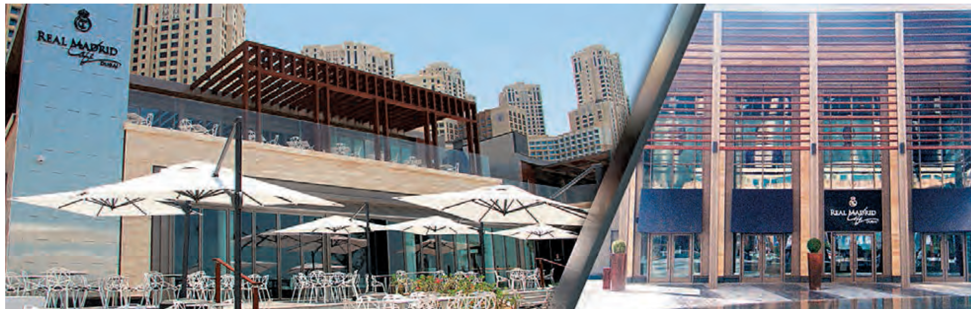
Real Madrid Café Dubai ocupa un lugar privilegiado en Jumeirah Beach Residence. EL CORREO

EXPECTACIÓN QUIENES REALICEN COMPRAS EN LA TIENDA OFICIAL PODRÁN LOGRAR UNA ENTRADA PARA LA HISTÓRICA JORNADA