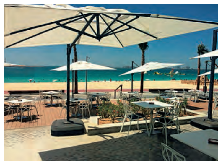
Real Madrid Café Dubai está en primera línea de playa. E. C.