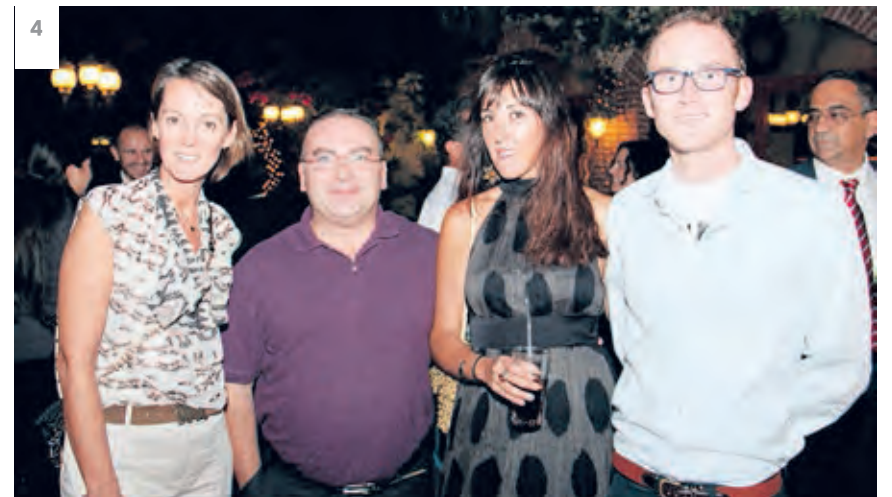
1. Exposición del artista pop americano Marco en Artissima Gallery Arte en Dubai. 2. El Rey Juan Carlos I de España junto al piloto Fernando Alonso durante el GP de Fórmula 1 de Abu Dhabi en el circuito de Yas Marina. 3. Encuentro del Spanish Business Council (SBC) de noviembre en Abu Dhabi celebrado en el hotel St. Regis de Saadiyat. 4. Encuentro del SBC correspondiente a octubre en Dubai, que tuvo lugar en el restaurante Seville´s. 5. Día de Muertos en la Embajada de México en Abu Dhabi. 6. Concierto de la Orquesta del Mayo Musical Florentino organizado por la Embajada de Italia en Abu Dhabi. 7. Inauguración en Medinat Jumeirah de la discoteca Pachá Ibiza Dubai. 8. El equipo Desert Palm Dubai levanta la copa como ganador del Trofeo de Polo Argentina La Martina 2014. 9. Fiesta Latina celebrada en el restaurante Lemon Tree del hotel Holiday Inn de Abu Dhabi.