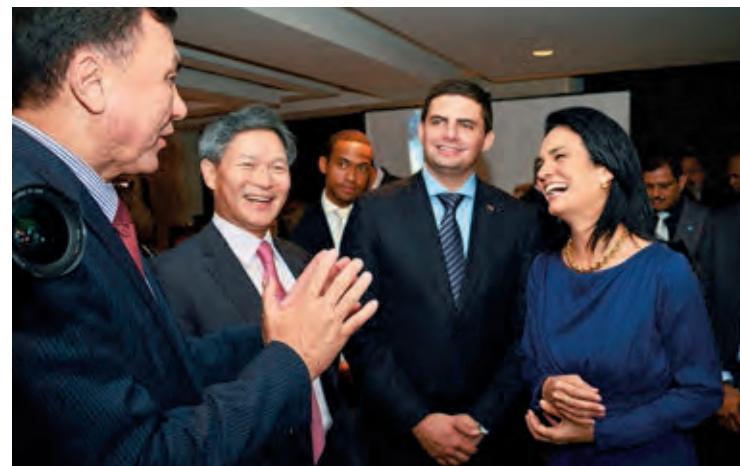
La vicepresidenta de Panamá, en Capital Club en Dubai.

En este orden de ideas informó que en su reunión con el ministro de Relaciones Exteriores, el Jeque Abdullah bin Zayed al Nayan, acordó negociar tres nuevos acuerdos