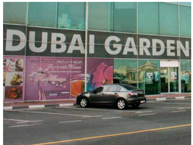
Vista de Dubai Garden Centre desde Sheikh Zayed Road.

que los alumnos tienen la oportunidad de aprender sobre las plantas.