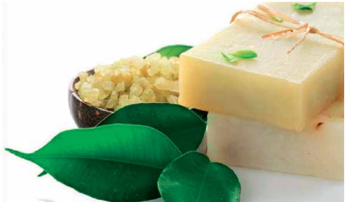
El Pabellón de España ofrece jabones artesanales de alta calidad.

El Pabellón de España en el Global Village, parque temático que cada año recibe más de cinco millones de personas, presentará en su portada tradicionales molinos de viento de la Mancha. Además, programará numerosas actividades y actuaciones que animarán cada día un recinto que está temporada se ha propuesto ser más español que nunca. Vaya reservando la entrada porque el espectáculo, donde no faltarán ni los 'Kojak', promete.