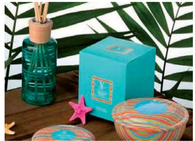
Velas aromáticas de Valencia cien por cien naturales y cosmética con aceite de oliva ecológico.