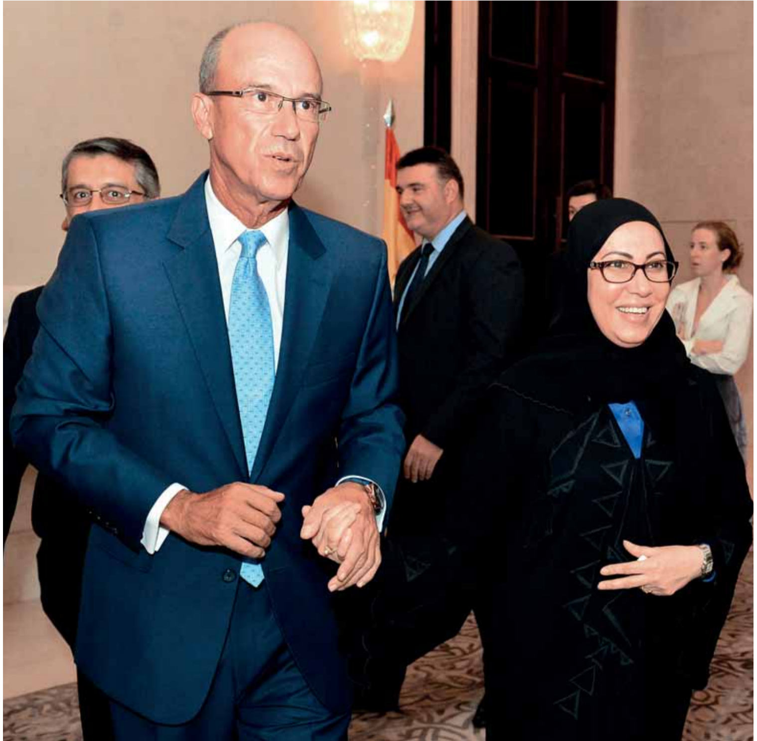
El embajador de España junto a la ministra de Asuntos Sociales de Emiratos Árabes, Mariam bint Mohammed Khalfan Al Roumi.

EL CORREO DEL GOLFO distribuyó durante la celebración de forma gratuita ejemplares del que en ese momento era su último número impreso y que salió a la calle con el título de portada "El español va a más".