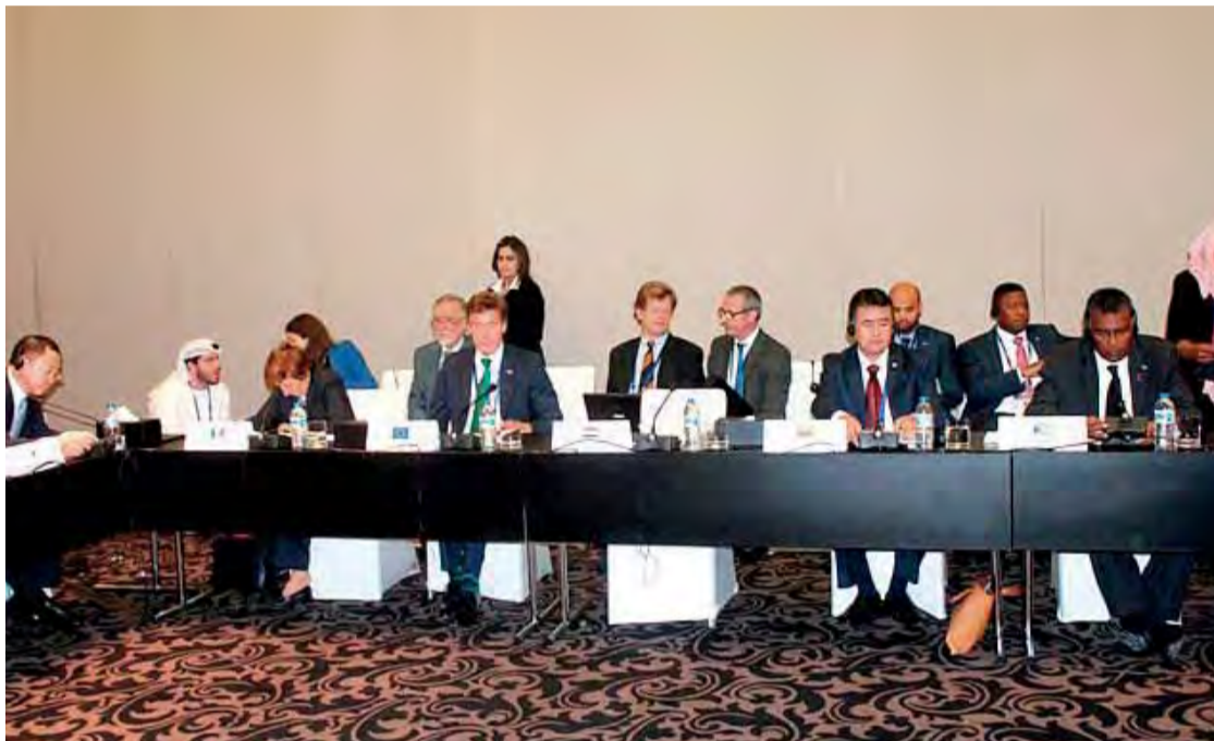
El delegado de Colombia -segundo por la derecha-, durante la conferencia.

En la conferencia se destacó que, gracias a la cooperación regional e internacional, se han reducido los episodios de ataques de piratas, pero precisamente el objetivo del cónclave ha sido resaltar que, además de tratar de sostener esta situación marítima, es importante realizar un trabajo integral en tierra que apunte al fortalecimiento institucional de Somalia y los países vecinos, así como aceptar la