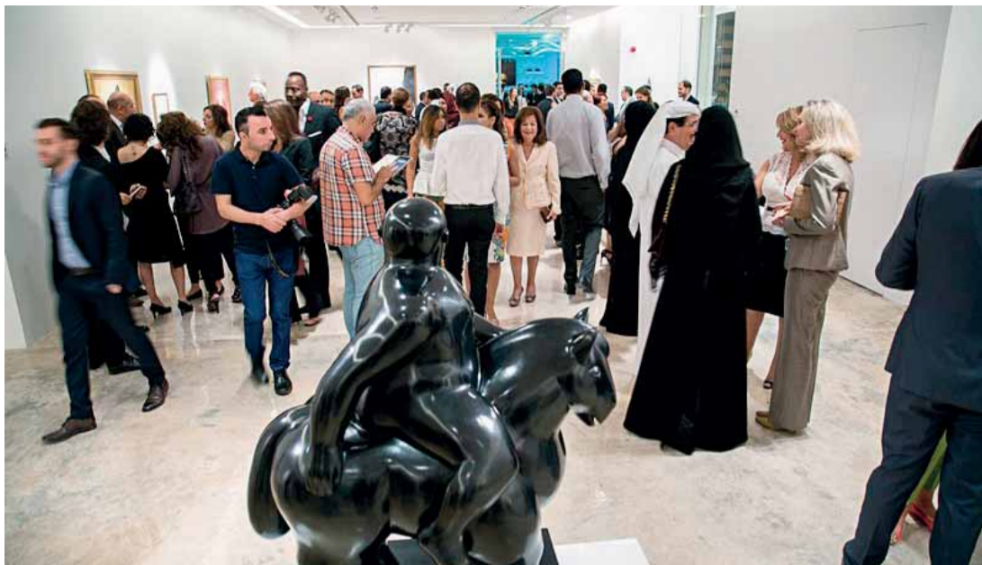
La inauguración, que tuvo una importante repercusión en los medios locales, reunió a numerosas personas en Doha. EL CORREO