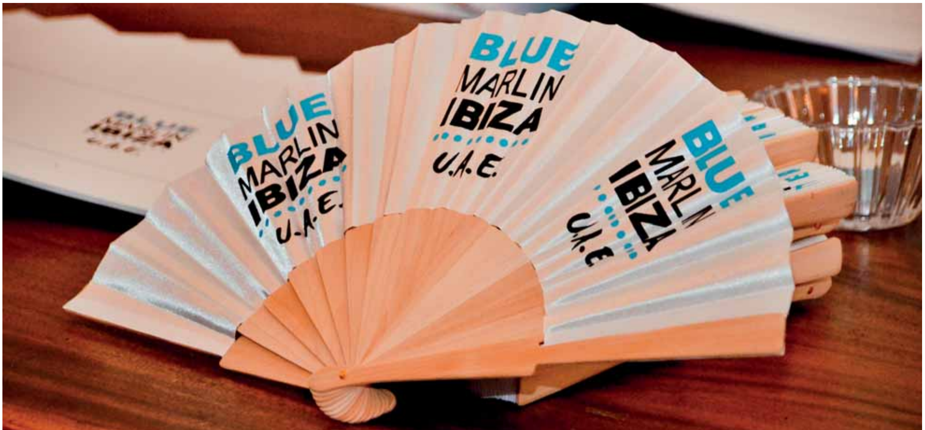
Blue Marlin Ibiza UAE fue el mejor antídoto para la calurosa noche de Abu Dhabi.