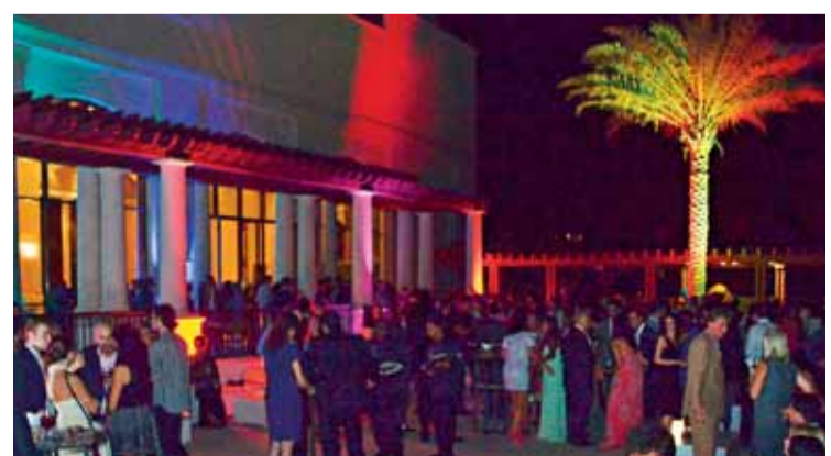
El lounge que Blue Marlin Ibiza UAE desplegó estuvo muy animado durante la tarde-noche del Día Nacional de España.