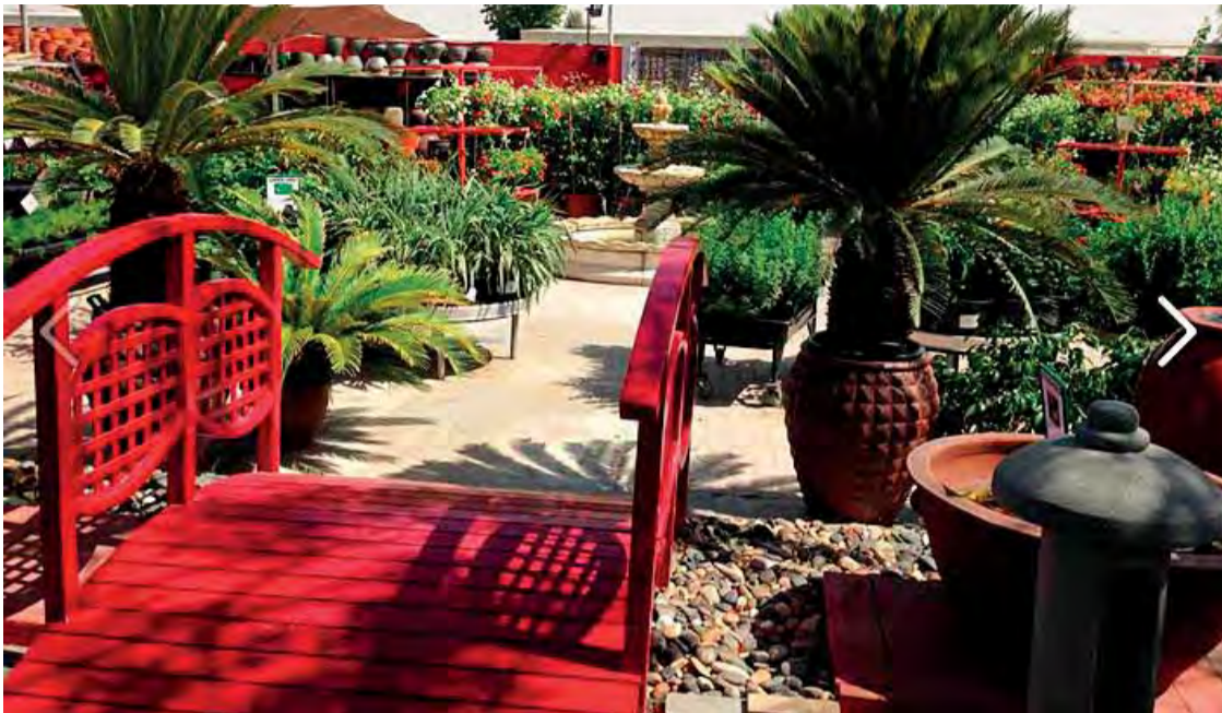
Zona de jardín con cerámicas, plantas y arbustos de exterior.