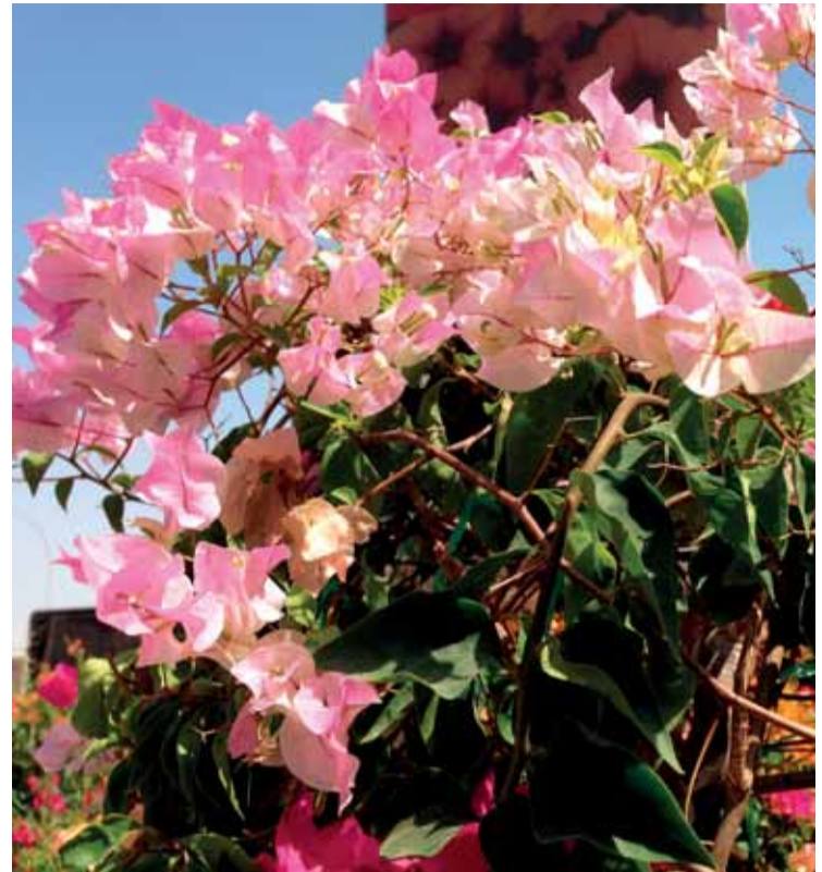
Exuberante planta en Dubai Garden Centre.

Todos los niños que visiten DGC pueden alimentar a los peces o encontrar a Danny, el dinosaurio mascota del centro, que se esconde en algún lugar. La tienda es muy popular por sus visitas escolares, en las