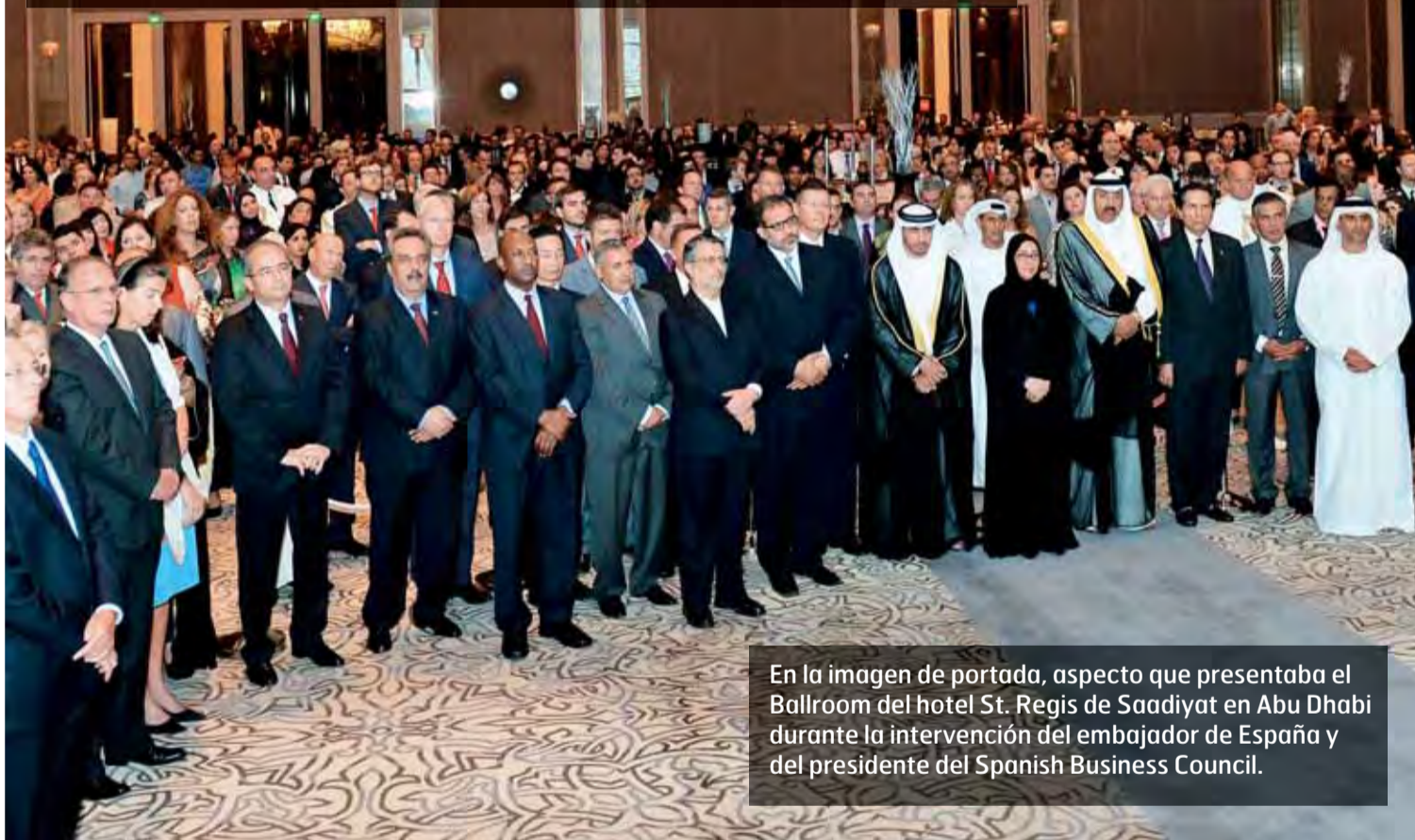
En la imagen de portada, aspecto que presentaba el Ballroom del hotel St. Regis de Saadiyat en Abu Dhabi durante la intervención del embajador de España y del presidente del Spanish Business Council.

Mil personas, entre ellas destacadas autoridades locales y numerosos representantes diplomáticos, asistieron al Día Nacional en el hotel St. Regis de Saadiyat en Abu Dhabi