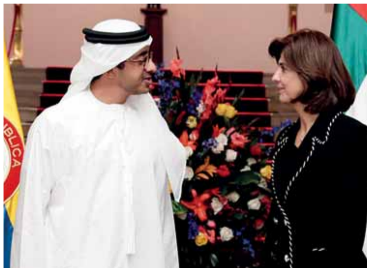
El ministro de Relaciones Exteriores de Emiratos Árabes Unidos, S. A. Abdullah bin Zayed Al Nahyan, junto a la canciller de Colombia, S. E. María Ángela Holguín.