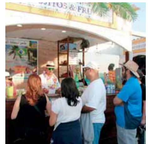
No faltarán los productos de caramelos Fiesta ni los refrescantes cóckteles.