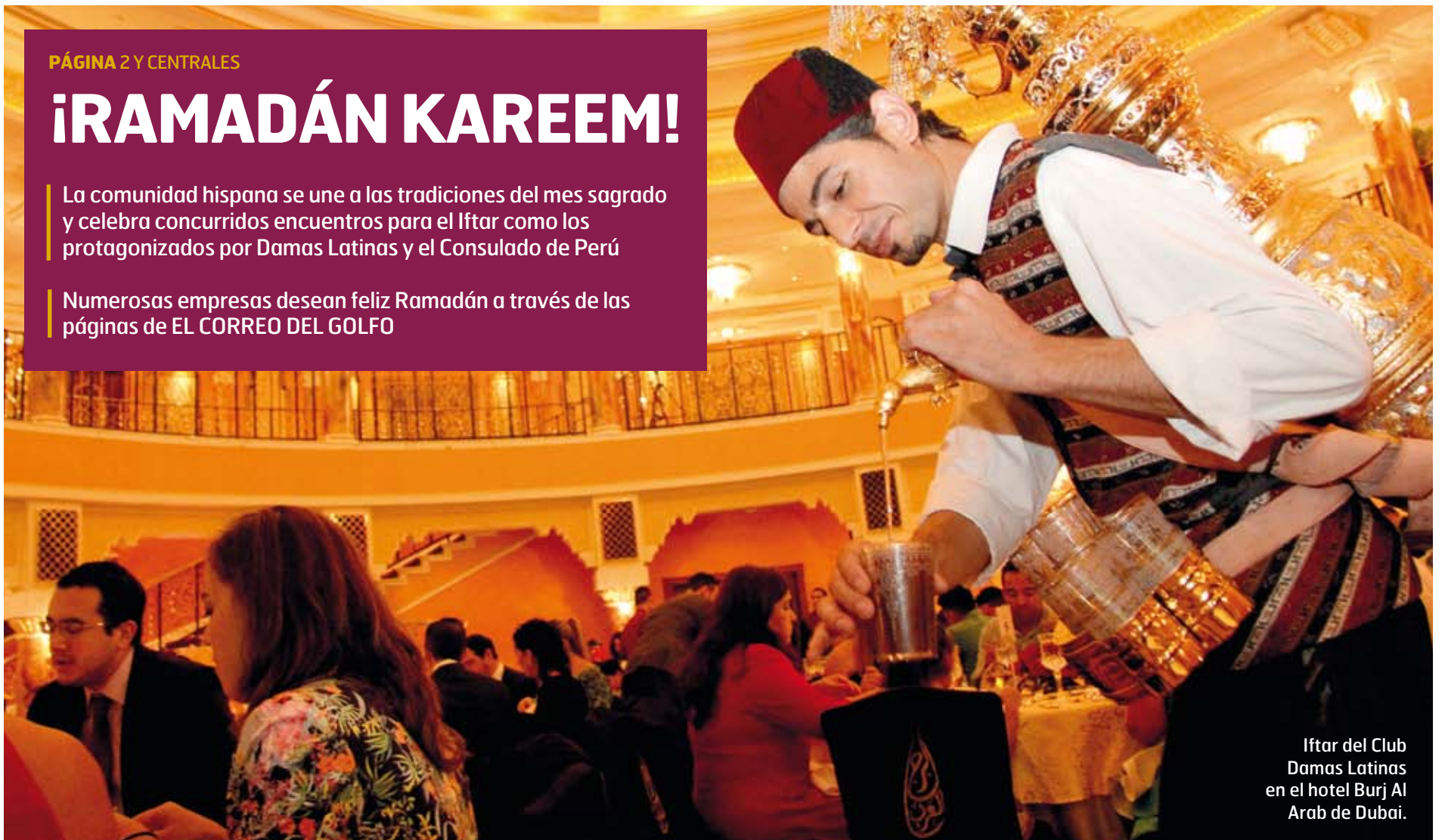
Iftar del Club Damas Latinas en el hotel Burj Al Arab de Dubai.

Numerosas empresas desean feliz Ramadán a través de las páginas de EL CORREO DEL GOLFO