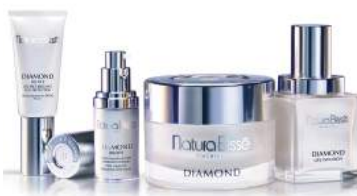
Productos de Natura Bissé de la línea 'Diamond Collection'. EL CORREO

pulsores de nuestra internacionalización”.