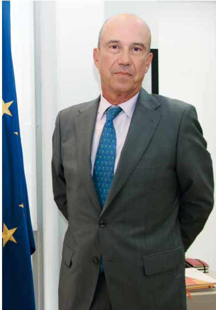
Salarich se lleva un gran recuerdo de Emiratos Árabes. EL CORREO

El tema más difícil al que me enfrenté cuando llegué fue el contencioso que había entre el Gobierno español y Masdar sobre las renovables. Afectaba a la inversión que había hecho Masdar en una empresa que se llama Torresol. Este problema estaba dañando la relación global y se resolvió con mucha paciencia y voluntad política por las dos partes. Para mí la prioridad número uno fue resolverlo y evitar que contaminara el resto de la relación política y económica. Se llegó a un acuerdo y, aunque no es plenamente satisfactorio, las aguas se han calmado. La prueba está en que