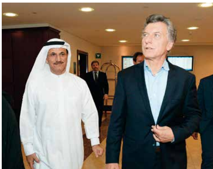
Macri, acompañado del ministro de Economía de Emiratos.