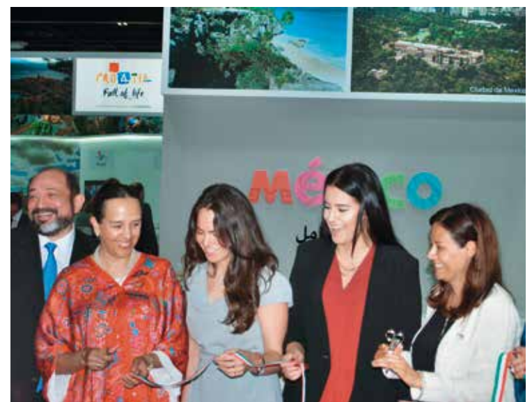
Inauguración de stand de México en la ATM.

Además, indicó que entre las metas que se marca Turespaña se encuentra “incrementar el negocio de España e impulsar la diversificación en la región de Asia y Oriente Medio, dando apoyo a las empresas interesadas en este mercado para que puedan venir a ferias como la ATM a un coste razonable y ofrecer sus productos”.