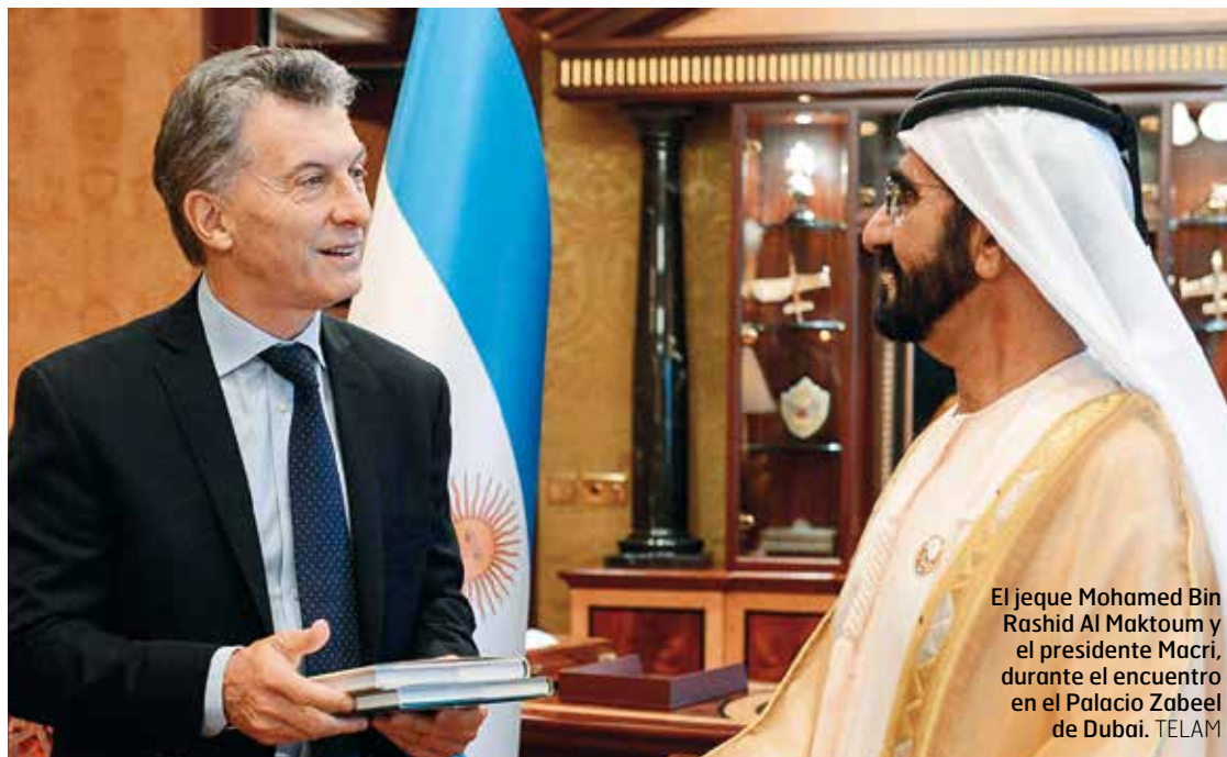
El jeque Mohamed Bin Rashid Al Maktoum y el presidente Macri, durante el encuentro en el Palacio Zabeel de Dubai.