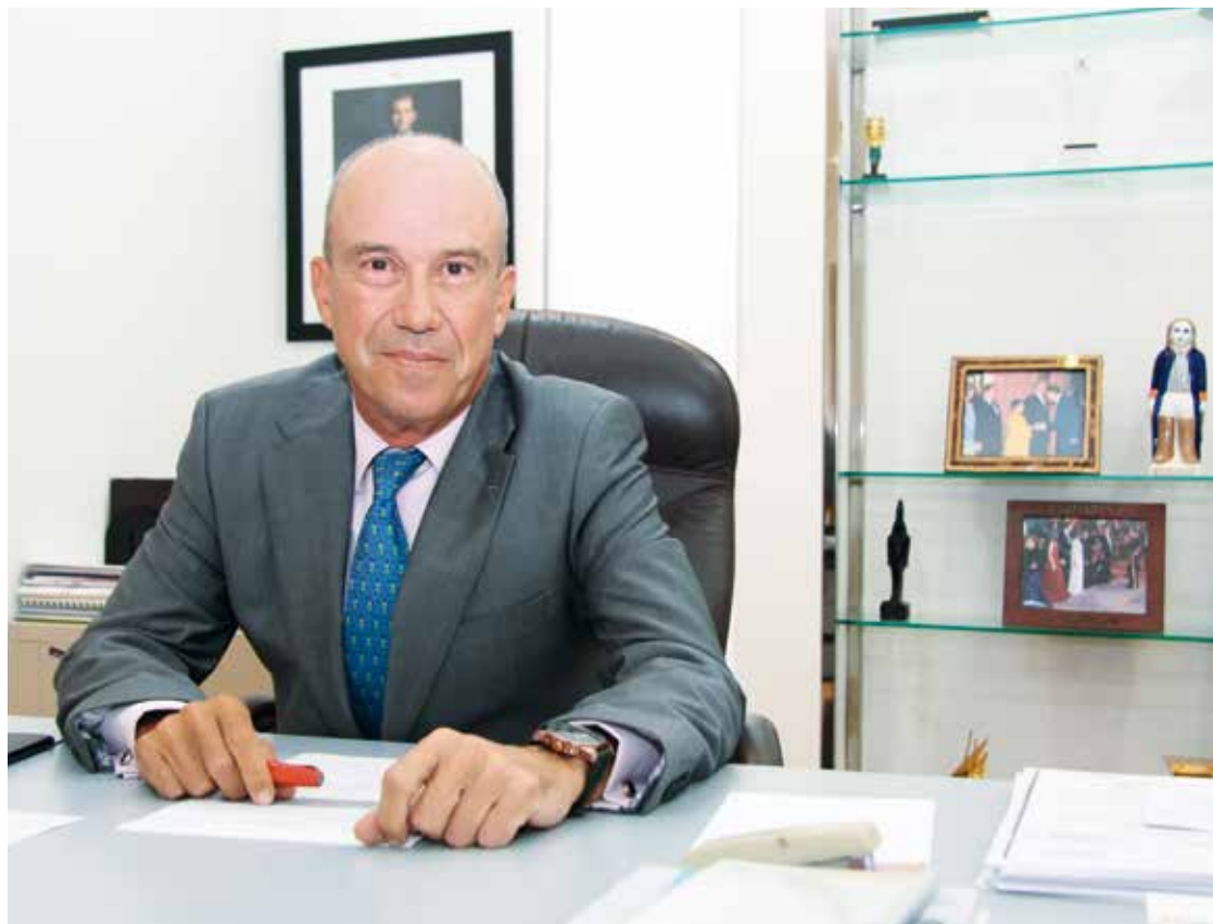
José Eugenio Salarich, en su despacho de la Embajada de España en Abu Dhabi.

España tiene tres prioridades geográficas: el Mediterráneo, que es nuestra zona de influencia clásica; Europa, que es el aire que respiramos, donde están nuestros socios y aliados; y otra es Iberoamérica. Por lo tanto, esta zona del mundo, la zona del Golfo, al igual que Asia y África, no es prioritaria, pero eso