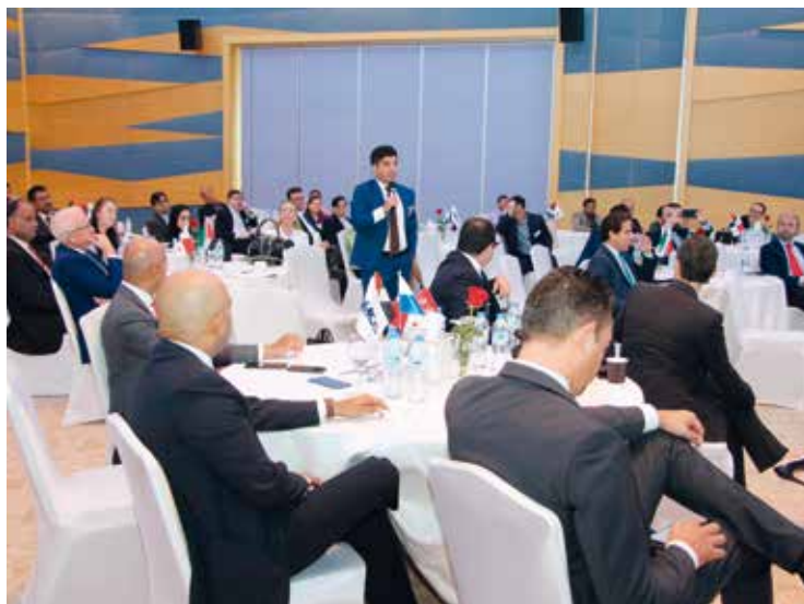
Aspecto del salón de Almas donde se desarrolló el encuentro.

Para ello, el ministro mantuvo reuniones con relevantes autoridades del país, entre las que se encontraba el jeque Mohammed bin Rashid Al Maktoum, vicepresidente de Emiratos Árabes y gobernante de Dubai. Asimismo llevó a cabo