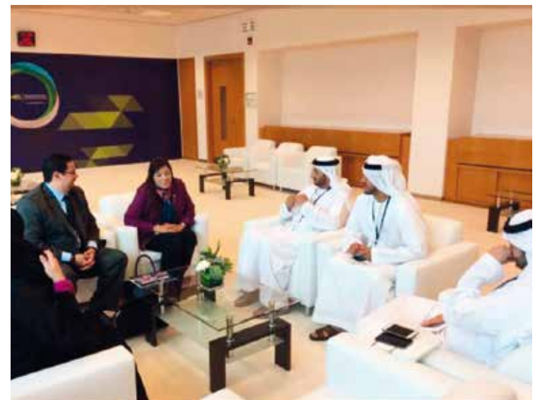
Reunión de la viceministra de El Salvador con autoridades emiratíes.

Según fuentes gubernamentales, Al Saleh explicó que se abordaron las oportunidades para estimular los nexos económicos, comerciales y de inversiones, al tiempo que contemplaron la posibilidad de asociaciones conjuntas en la industria turística entre compañías salvadoreñas y emiratíes.