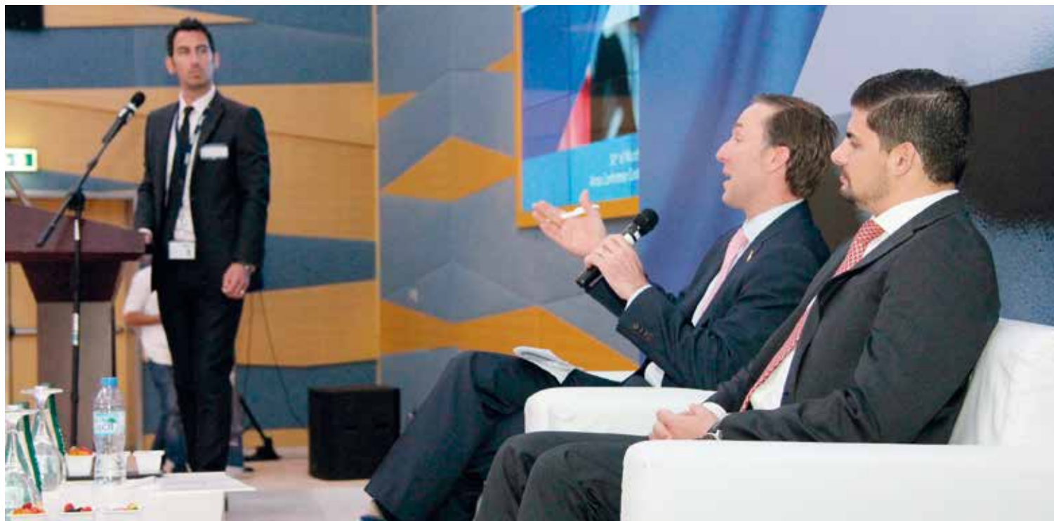
El ministro de Industria de Panamá -sentado a la izquierda- junto al embajador de su país en Emiratos Árabes -a la derecha-. EL CORREO