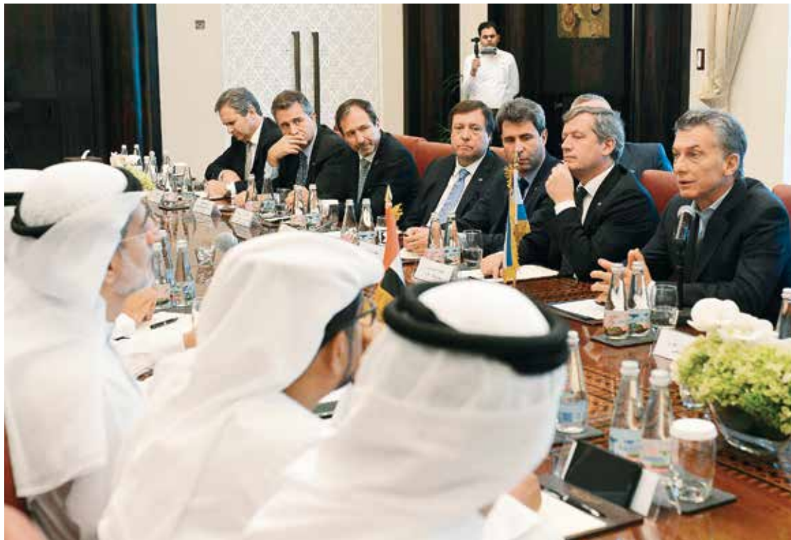
Encuentro del presidente de Argentina con autoridades y representantes de empresas emiratíes.

En la reunión estuvieron presentes por parte emiratí el jeque Maktoum bin Mohamed bin Rashid Al Maktoum, vicegobernador de Dubai; el jeque Ahmed bin Saeed Al Maktoum, presidente de la Aviación Civil de Dubai; el jeque Ahmed bin Mohamed bin Rashid Al Maktoum, presidente de la Fundación Mohamed bin Rashid Al Maktoum Conocimiento; Mohamed bin Abdullah Al Gergawi, ministro de Asuntos del Futuro; Sultan bin Saeed Al Man-